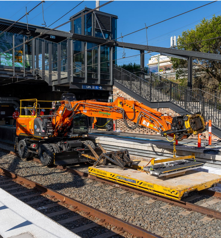
الصورة أعلاه: أعمال تحويل مترو سيدني في هرلستون بارك

سيعمل مترو سيدني كخدمة 'احضر واركب'، حيث تعمل القطارات كل أربع دقائق خلال ساعات الذروة - أي 15 قطارًا في الساعة. وخلال فترة الذروة الصباحية التي تبلغ ثلاث ساعات، سيكون مترو سيدني قادرًا على نقل 51000 شخص في كل اتجاه بين بانكستاون والوسط التجاري في سيدني - وهو ما يزيد بـ15000 شخص عن العدد الحالي.